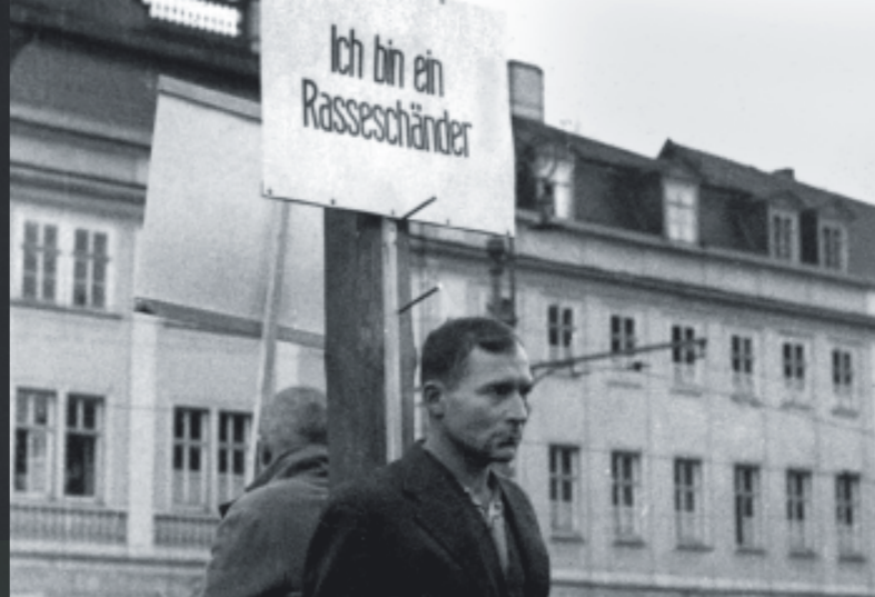
Eisenach, 15. November 1940. Unter dem Vorwurf des „verbotenen Umgangs“ wurden sowohl deutsche Frauen als auch Zwangsarbeiter öffentlich gedemütigt, meist auf Initiative von Parteifunktionären.