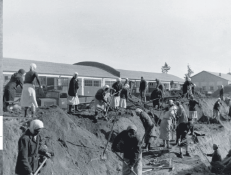
Zwangsarbeiterinnen auf dem Gelände des Daimler-Werkes in Minsk, September 1942.

Im Zweiten Weltkrieg wurden in Deutschland auf nahezu jeder Baustelle und jedem Bauernhof, in jedem Industriebetrieb und auch in Privathaushalten Zwangsarbeiter ausgebeutet. Dort wie in den besetzten Gebieten mussten insgesamt über 20 Millionen Männer, Frauen und Kinder aus ganz Europa als „Fremdarbeiter“, Kriegsgefangene oder KZ-Häftlinge Zwangsarbeit leisten.