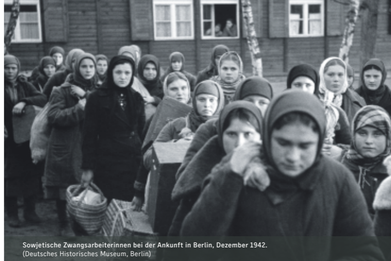
Sowjetische Zwangsarbeiterinnen bei der Ankunft in Berlin, Dezember 1942.

Ort: Berlin-Brandenburgische Akademie der Wissenschaften, Markgrafenstraße 38, Berlin-Mitte