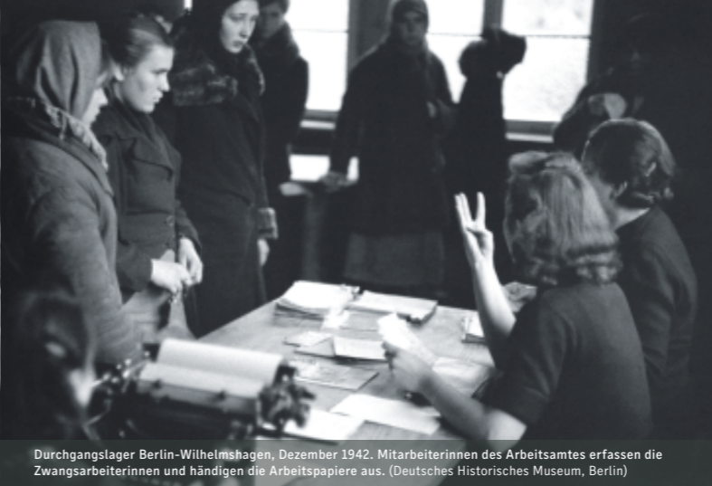
Durchgangslager Berlin-Wilhelmshagen, Dezember 1942. Mitarbeiterinnen des Arbeitsamtes erfassen die Zwangsarbeiterinnen und händigen die Arbeitspapiere aus.