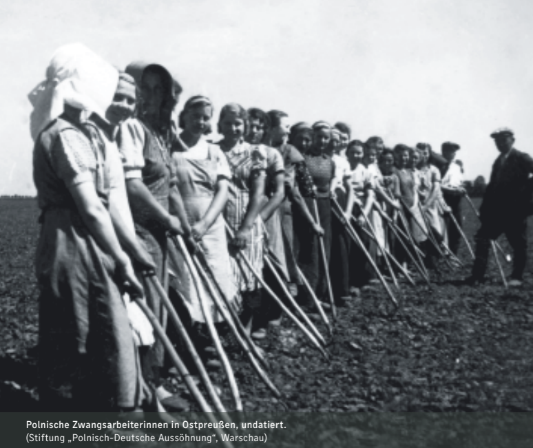
Polnische Zwangsarbeiterinnen in Ostpreußen, undatiert.