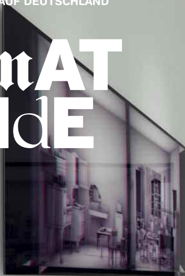
Raumsicht der Sonderausstellung »Heimatkunde. 30 Künstler blicken auf Deutschland.