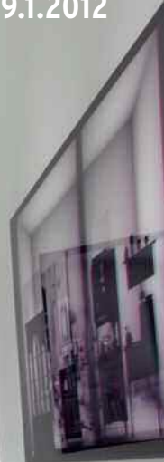
1 Via Lewandowsky & Durs Grünbein, »Windhauch, Windhauch«, Mixed Media Installation, 2011