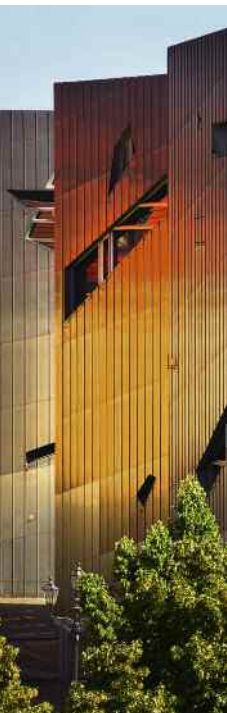
Fassade Neubau